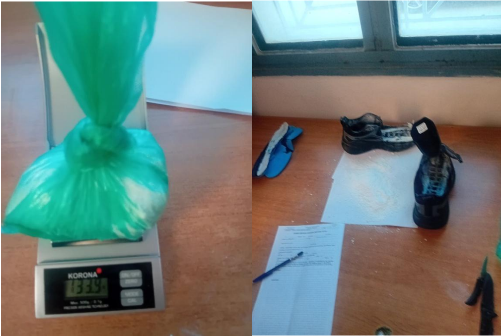
ΦΩΤΟΓΡΑΦΙΕΣ ΑΠΟ ΤΟ Σ.Κ. ΔΟΜΟΚΟΥ